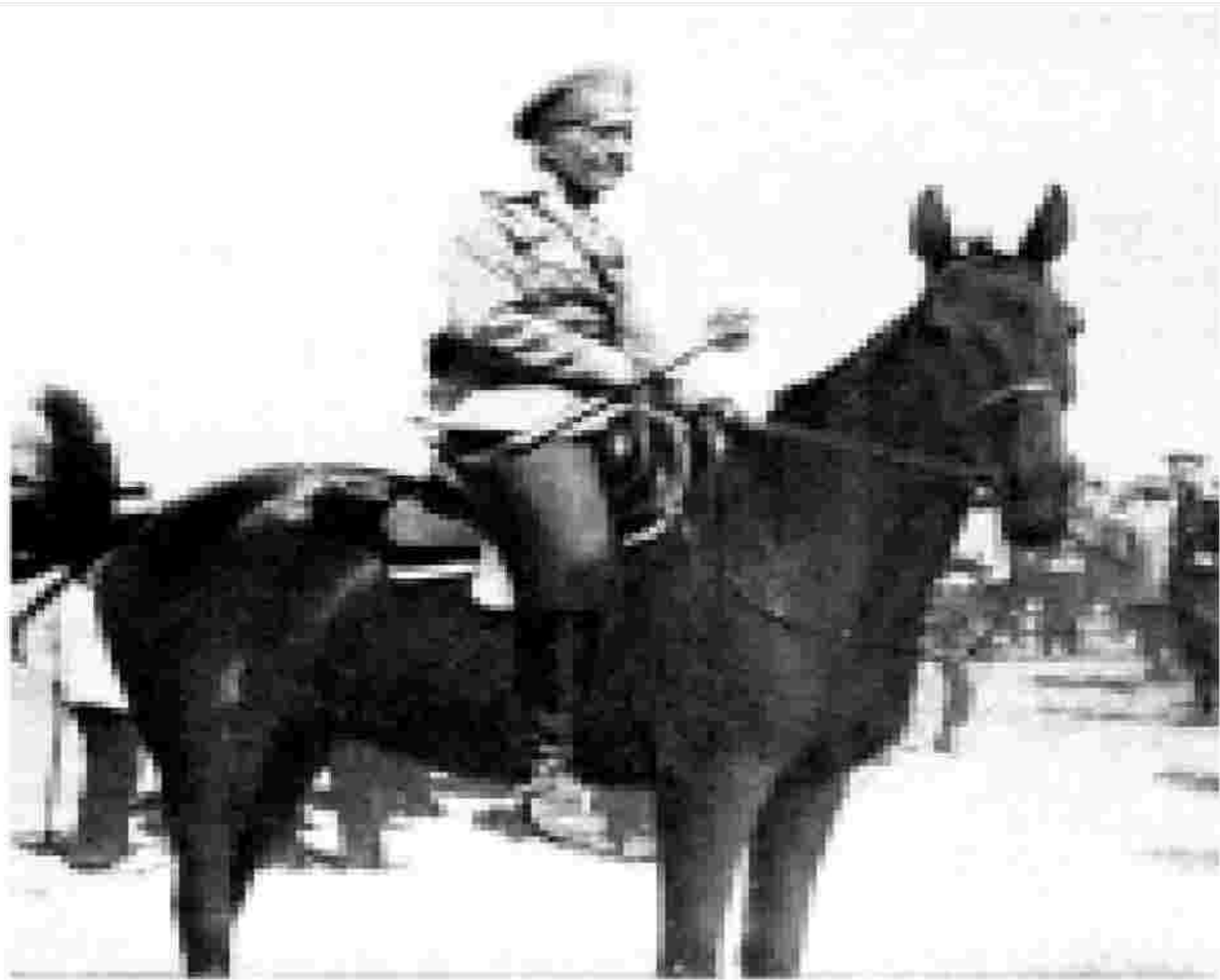
Атаман Краснов П.Н. принимает парад молодой гвардии.

- Когда стоит вопрос о правах государства, вопрос о правах