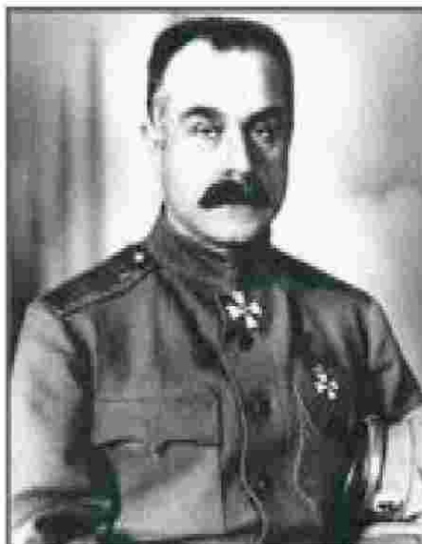
Герой Брусиловского прорыва генерал от кавалерии А.М. Каледин

Деды, и «побелевшие», и «покрасневшие», не были пацифистами, они не речами, а делами отстаивали свои взгляды. Через год, 17 мая 1918 года Войсковой Круг Спасения Дона подтвердил решения предыдущих Кругов и официально объявил о создании казачьего государства Всевеликое