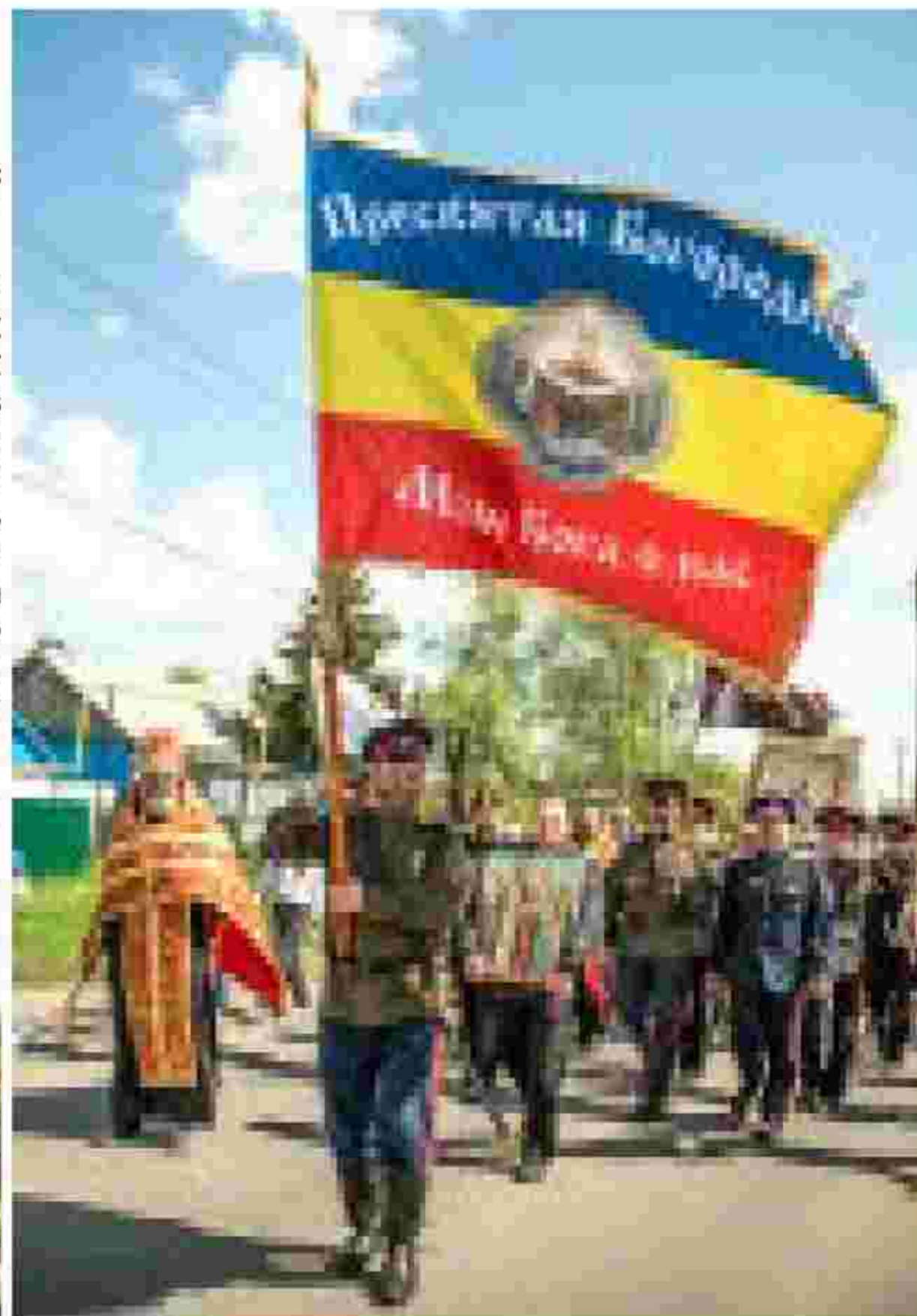
Казаки и кадеты Войска Донского на крестном ходе.