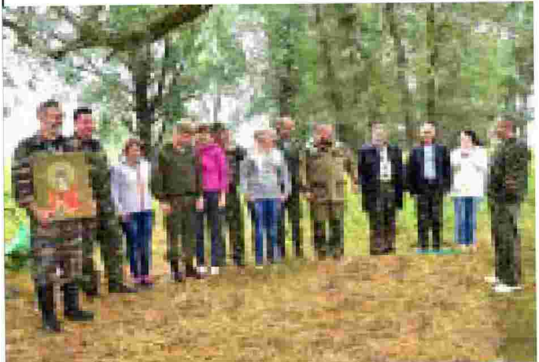
Казаки Медведицкого округа Войска Донского СКР поднесли в день рождения Войсковому Атаману образ равноапостольного князя Владимира.