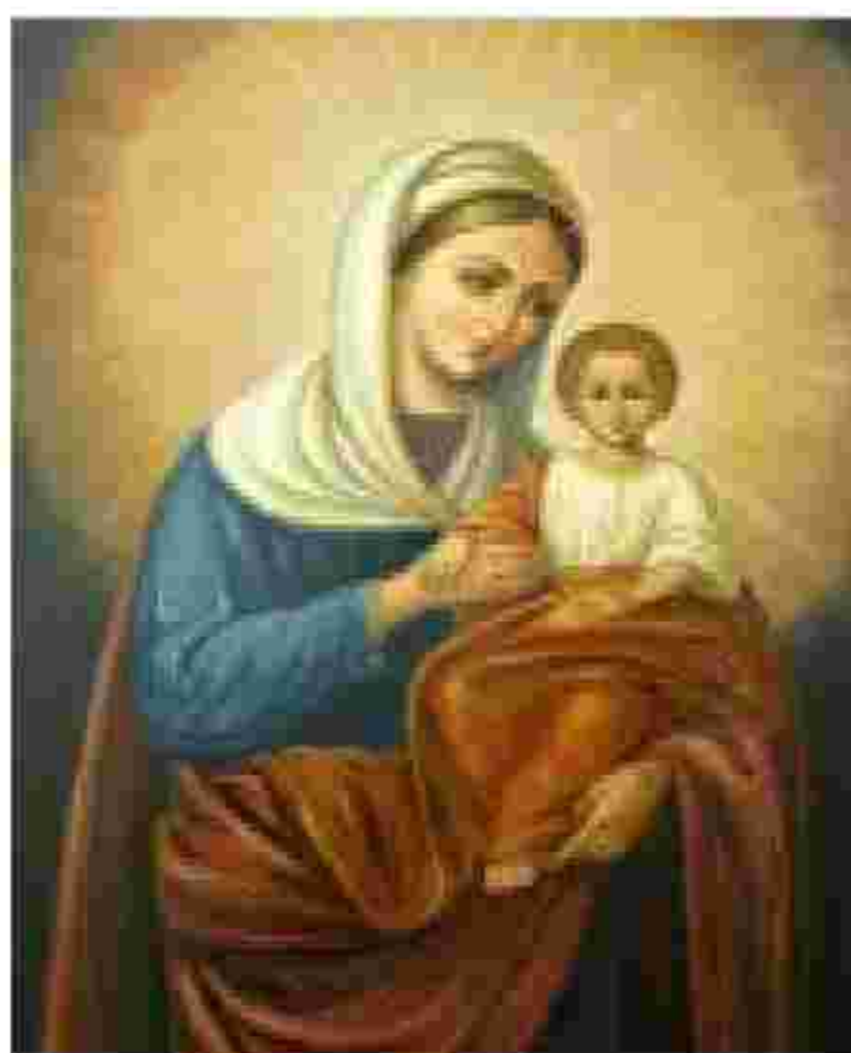
21 июня - явление Урюпинской иконы Божьей Матери

Напряжение вокруг обглоданной демками России растёт не по дням, а по часам. Пшекалки с мамольжниками (поляки и румыны) Россию не любили, даже кормясь с нашей руки. Православные братушки, освобождённые из-под многовекового владычества турок русской кровью, захотели католическо-протестантских «ценностей» вплоть до радужных знамён над своими алтарями. Появившаяся на карте Мира благодаря Александра Первого и Владимира Ульянова Финляндия, демократизированная в своё время генералом РИА Маннергеймом, и та потянулась к НАТО. Турция разогревает Закавказье и руками джихадистов лезет в Дагестан. Судороги бегут по мандариновой Абхазии. Приднестровье в фактической блокаде. Средняя Азия никак не определиться, в чьём казане плов жирнее. Даже достали аксакала СССР – СНГ – вольного Казахстана Назарбаева попытками цветочных бурь. А вчерашние выпускники советских вузов и ВПШ вообще из штанов готовы выпрыгнуть, лишь бы доказать, что они демократичнее и либеральнее самого Абама. Хохлы не