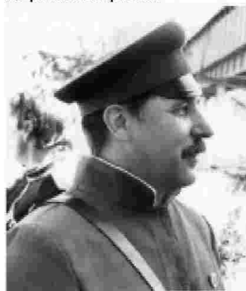
29 июня 1990г., подворье Донского монастыря.

29 июня 1990 года – В Москве создана общественная организация «Союз казаков», тогда всего СССР. Дон на Учредительном Круге представляли делегаты от Вёшек, Ростова, Новочеркаска, Хопра и Медведицы. Атаманом Союза казаков избран донской казак Александр Гаврилович Мартынов