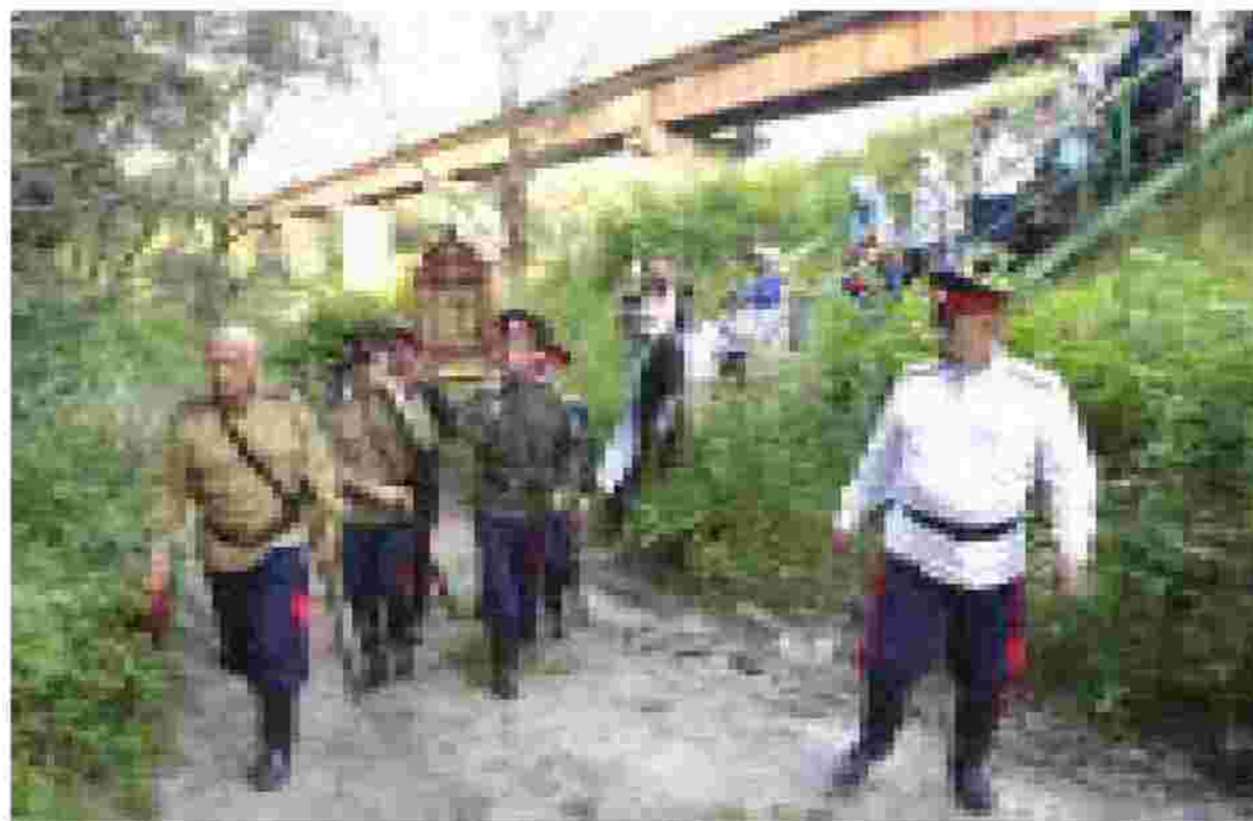
Крестный ход к Святому Источнику, месту Явления Иконы Божьей Матери