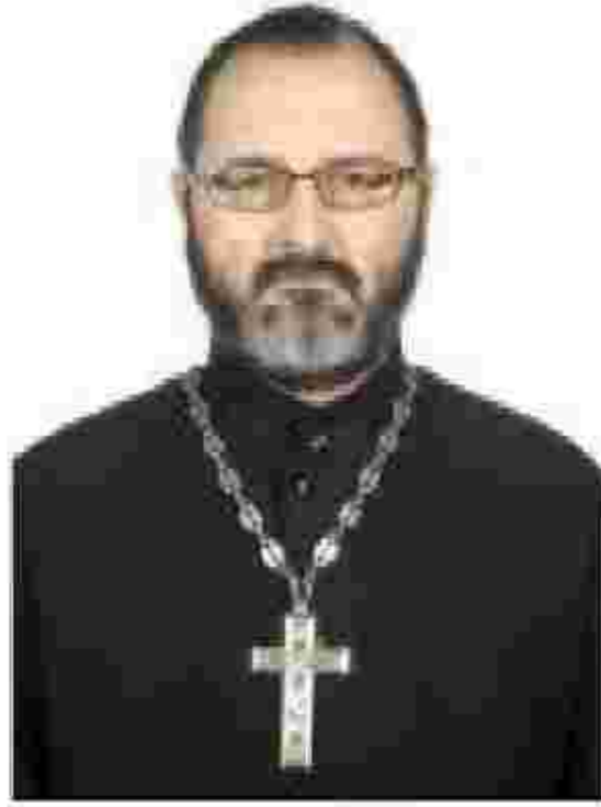
(Продолжение. Начало в № 5.)

После этого следует возглас «Господи, спаси благочестивыя...», который сохранился из церемониала византийской службы, за которой присутствовали цари. И сразу следует пение Трисвятого «Святый Боже, святый Крепкий, святый Безсмертный, помилуй нас». Во время пения Трисвятого совершается восхождение священнослужителей на горнее место в алтаре, место, на котором может восседать только архиерей, символизируя собой Христа. Восхождение на горнее место происходит для слушания Священного Писания, поэтому именно оттуда предстоятель преподаёт всем собравшимся мир, для нашего слышания слова Божия. Чтение Священного Писания предваряется пением прокимна (в переводе с греческого – предлежащий). Прокимен из стиха, в собственном смысле называемом прокимном, и одного или трёх «стихов», которые предшествуют повторению прокимна.