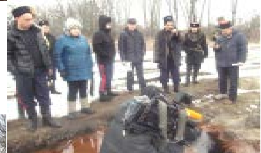
Съёмочная группа РЕН-ТВ на Сорокинском поле и Пыховской скважине Новохоперского р-на Воронежской обл. ведёт съёмки и измеряет уровень радиационного фона в активистами против разработок никеля и казаками.

Казаки Войска Донского СКР от всего сердца благодарят участников пикетов протеста всей России-Матушки за поддержку донцов!