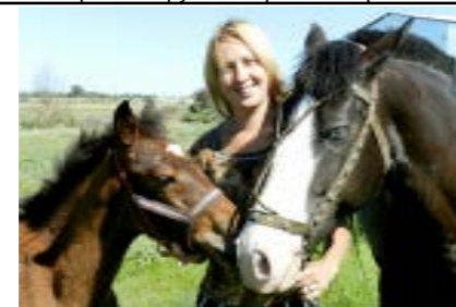
Конноспортивный клуб «Котовский»

27 апреля 1990 года в зале заседаний Дома Советов состоялось учредительное собрание общественной организации «Хопёрский округ». Собрание открыл и вёл