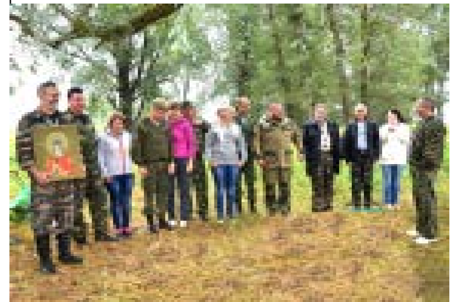
Казачи Медведицкого округа Войска Донского СКР поднесли в день рождения Войсковому Атаману образ равноапостольного князя Владимира.