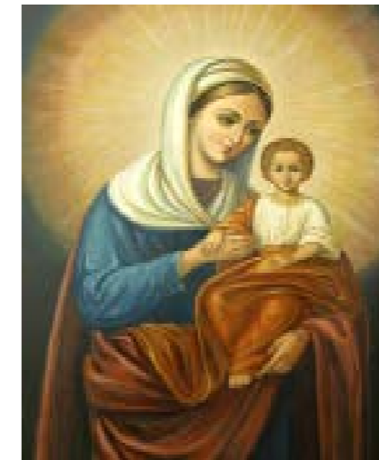
21 июня - явление Урюпинской иконы Божьей Матери

Напряжение вокруг обглоданной демками России растёт не по дням, а по часам. Пшекалки с мамольжниками (поляки и румыны) Россию не любили, даже кормясь с нашей руки. Православные братушки, освобождённые из-под многовекового владычества турок русской кровью, захотели католическо-протестантских «ценностей» вплоть до радужных знамён над своими алтарями. Появившаяся на карте мира благодаря Александра Первого и Владимира Ульянова Финляндия, демократизированная в своё время генералом РИА Маннергеймом, и та потянулась к НАТО. Турция разогревает Закавказье и руками джихадистов лезет в Дагестан. Судороги бегут по мандариновой Абхазии. Приднестровье в фактической блокаде. Средняя Азия никак не определится, в чьём казане плов жирнее. Даже достали аксакала СССР – СНГ – вольного Казахстана Назарбаева попытками цветочных бурь. А вчерашние выпускники советских вузов и ВПШ вообще из штанов готовы выпрыгнуть, лишь бы доказать, что они демократичнее и либеральнее самого Абама. Хохлы не