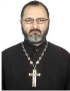
(Продолжение. Начало в № 5.)

После этого следует возглас «Господи, спаси благочестивыя...», который сохранился из церемониала византийской службы, за которой присутствовали цари. И сразу следует пение Трисвятого «Святый Боже, святый Крепкий, святый Безсмертный, помилуй нас». Во время пения Трисвятого совершается восхождение священнослужителей на горнее место в алтаре, место, на котором может восседать только архиерей, символизируя собой Христа. Восхождение на горнее место происходит для слушания Священного Писания, поэтому именно оттуда предстоятель преподает всем собравшимся мир, для нашего слышания слова Божия. Чтение Священного Писания предваряется пением прокимна (в переводе с греческого – подлежащий). Прокимен из стиха, в собственном смысле называемом прокимном, и одного или трёх «стихов», которые предшествуют повторению прокимна.